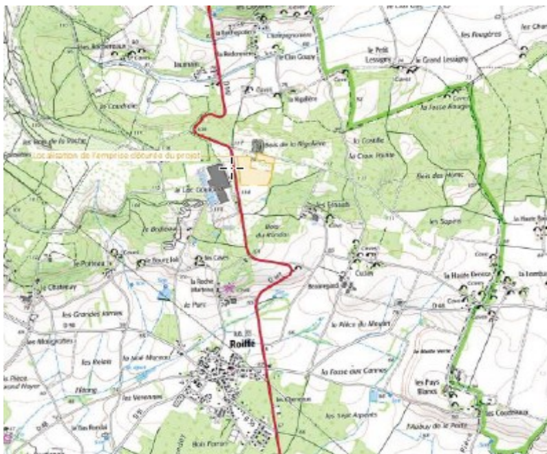
Plan de situation – extrait étude d'impact page 18

La localisation du parc photovoltaïque est présentée ci-après.